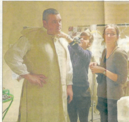
Chaque élève est à la fois costumière (à droite) et assistante pour un autre (duc d'Orléans).

Samedi, une délégation avesnoise s'est rendue à Villejuif en région parisienne pour procéder aux essayages, les premiers pour les hommes,