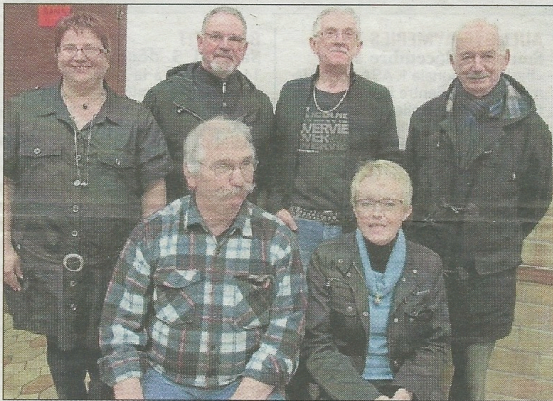
L'association s'est dotée d'un nouveau bureau. Le « Chevalier des mouches », joué en juin, avait rassemblé 3 000 spectateurs.

spectacles, et Equi Vie de Stéphane Bulot qui a fourni la compétence équestre du Chevalier des mouches .