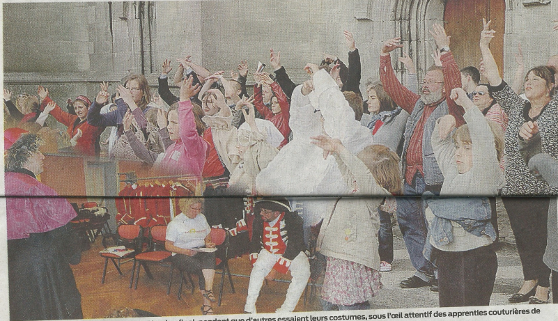
Certains répètent les pas de danse du Rigodon final, pendant que d'autres essaient leurs costumes, sous l'œil attentif des apprenties couturières de l'école La Source.

Pendant cinq soirs, la cité des Mouches opère un voyage dans le passé. Les Avesnois ont rendez-vous avec le roi Louis XIV, en 1667. Et tout commence ce vendredi 10 juin.