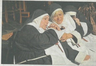
Dans l'église, trois bonnes sœurs se chuchotent le secret du chevalier des mouches...