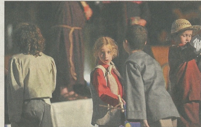
Les enfants s'en sont donné à cœur joie, lors des scènes de duels et de jeux, étonnants de naturel et d'entrain à cette heure pourtant tardive.