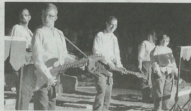
Des acteurs du monde de la pierre.

« C'est une belle aventure qui se termine. »