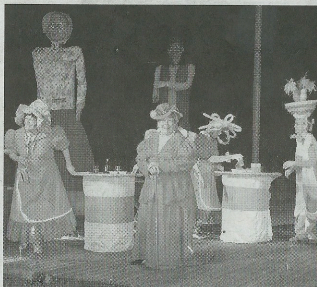
La fête, toujours au rendez-vous dans le VaJoly.