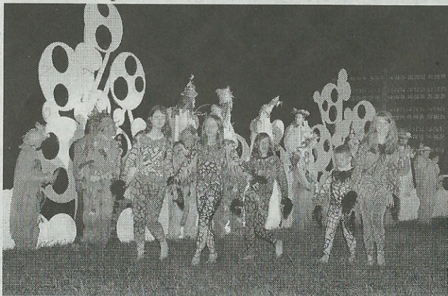
Les enfants étaient porteurs d'un message.